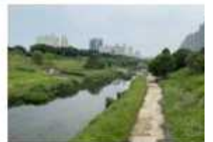
4. 아산병원 방면 경