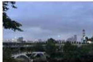
3. 아산병원 방면 풍경