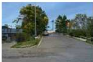
2. 빛울림프장 방면 도로